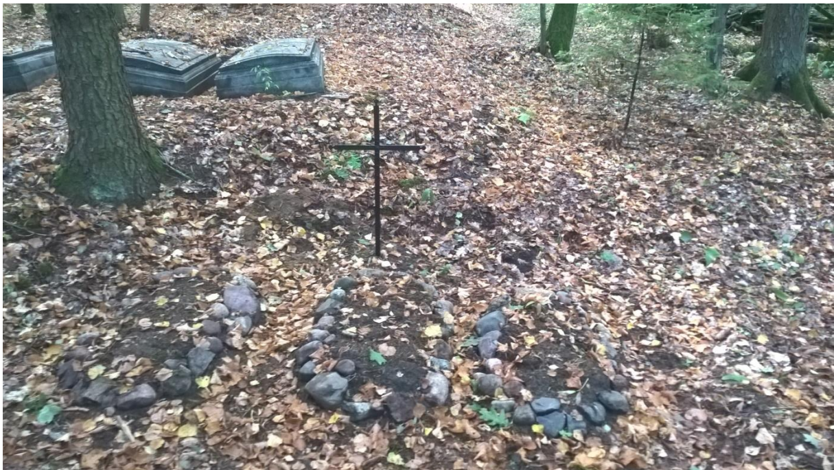
Ryc.19 Groby nr. 25-27, po przeprowadzeniu prac porządkowych, wrzesniu 2019

Trzy dziecięce groby ziemne, pośrodku jest wbity prosty metalowy krzyż.