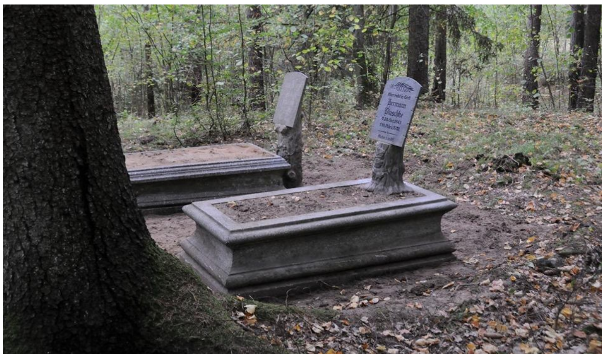
Ryc. 13 Groby rodziny Blaschke, wrzesień 2019.