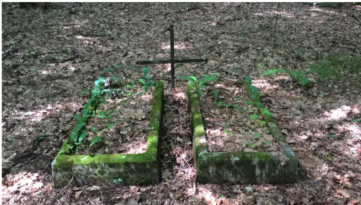
Ryc. 13 Groby 19 i 20, lipiec 2019.

Kolejne dwie betonowe opaski, przed nimi wbity w ziemię prosty metalowy krzyż.