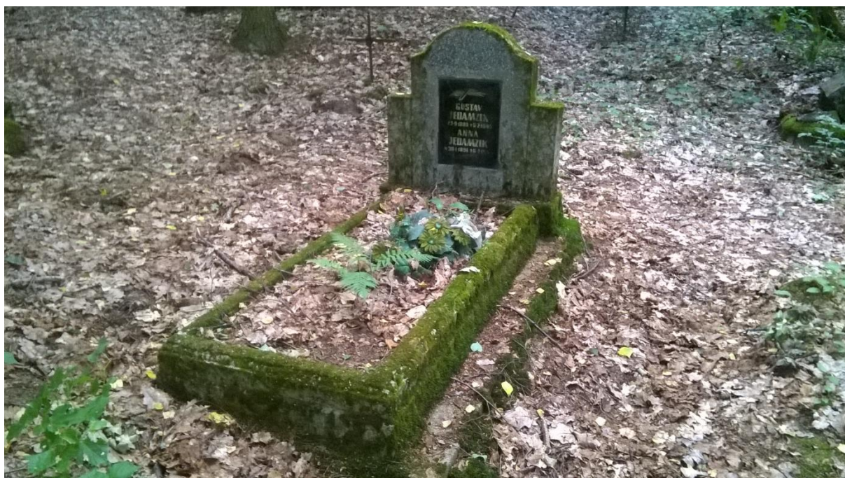
Ryc.10 Grób rodziny Jedamzik, lipiec 2019.