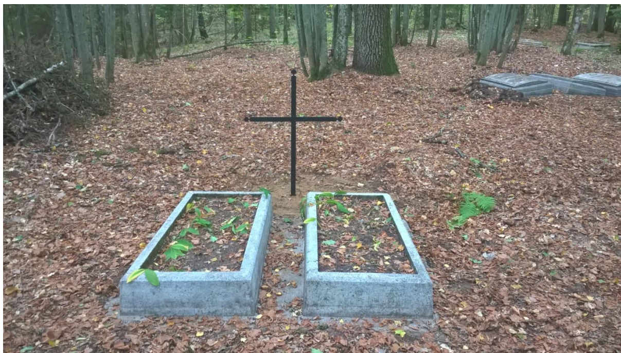
Ryc.14 Groby 19 i 20, wrzesień 2019.