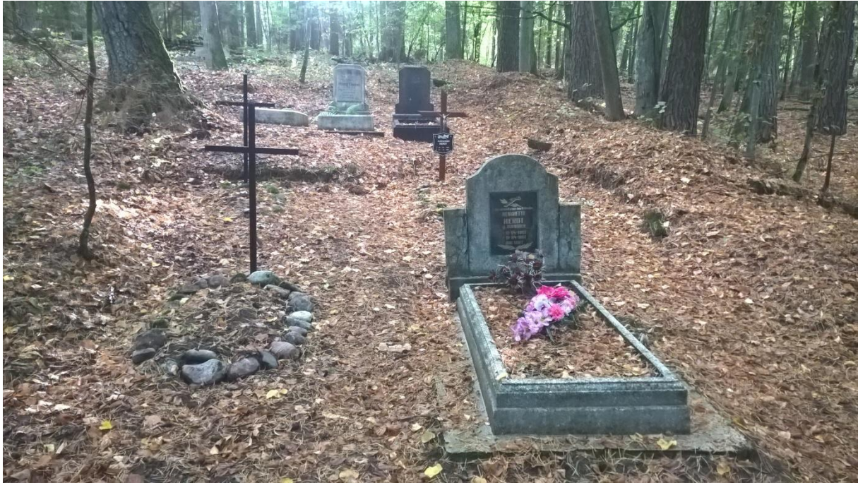
Ryc. 5 Na pierwszym planie widzimy groby nr 4 i 5, za nimi znajdują się groby 6 i 7. Stan na wrzesień 2019 roku, po przeprowadzeniu prac porządkowych.