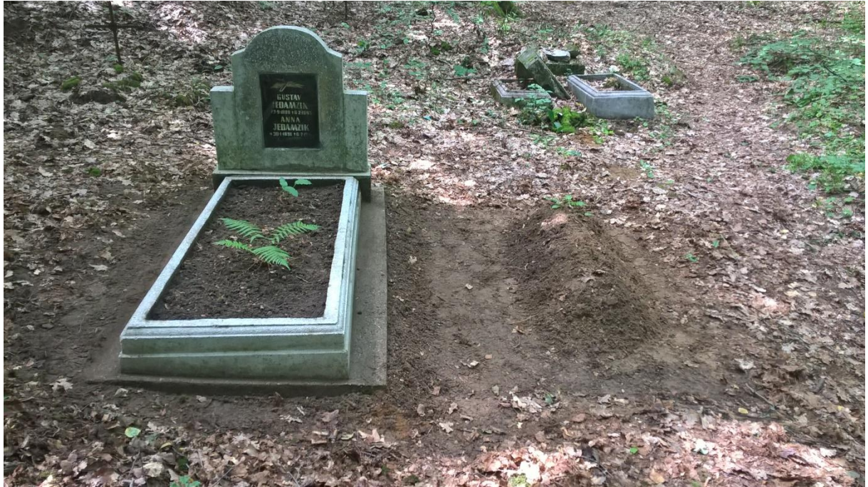
Ryc.11 Groby nr 15 i 16, po pracach wykonanych latem 2019 roku.