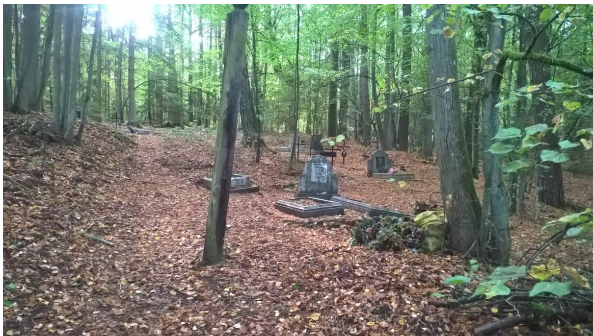
Ryc.1 Widok ogólny cmentarza, Wrzesień 2019.