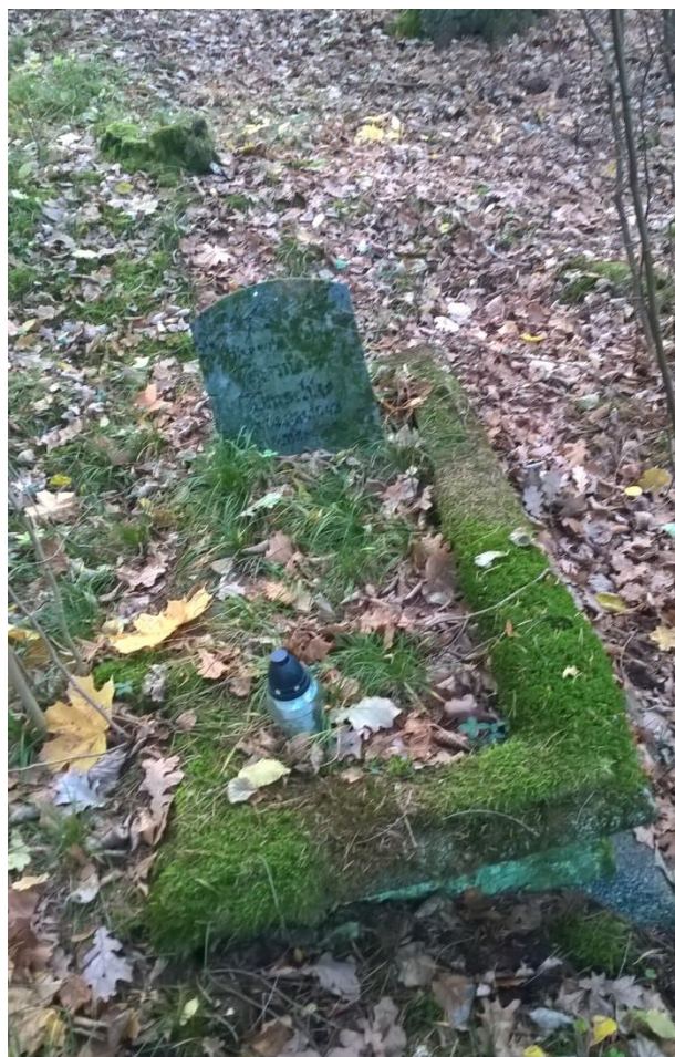
Ryc. 15 i 16 Groby rodziny Blaschke w listopadzie 2018 roku.