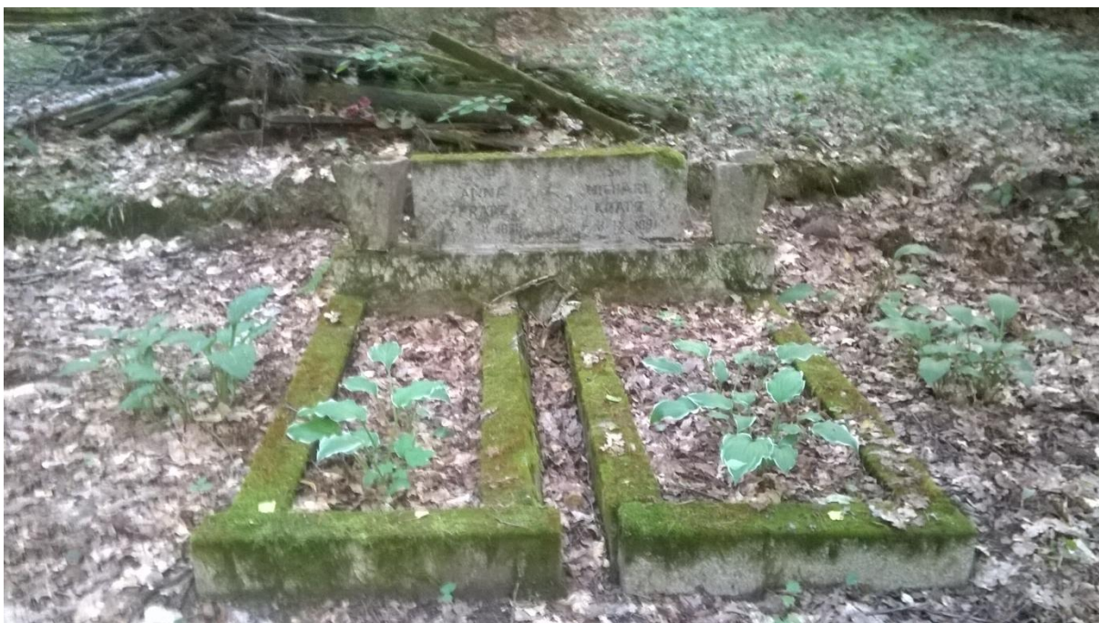
Ryc.8 Grób rodziny Kratz, po lewej znajduje się ledwo widoczny grób ziemny. Widoczne resztki drewnianego ogrodzenia, lipiec 2019.