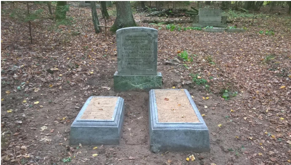
Ryc.18 Nagrobek po naprawie, wrzesień 2019.