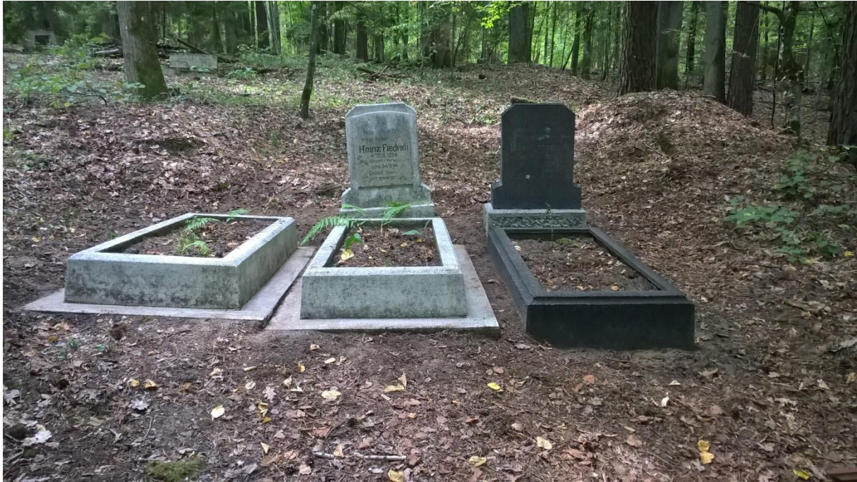
Ryc.7 Te same groby po oczyszczeniu w sierpniu 2019.