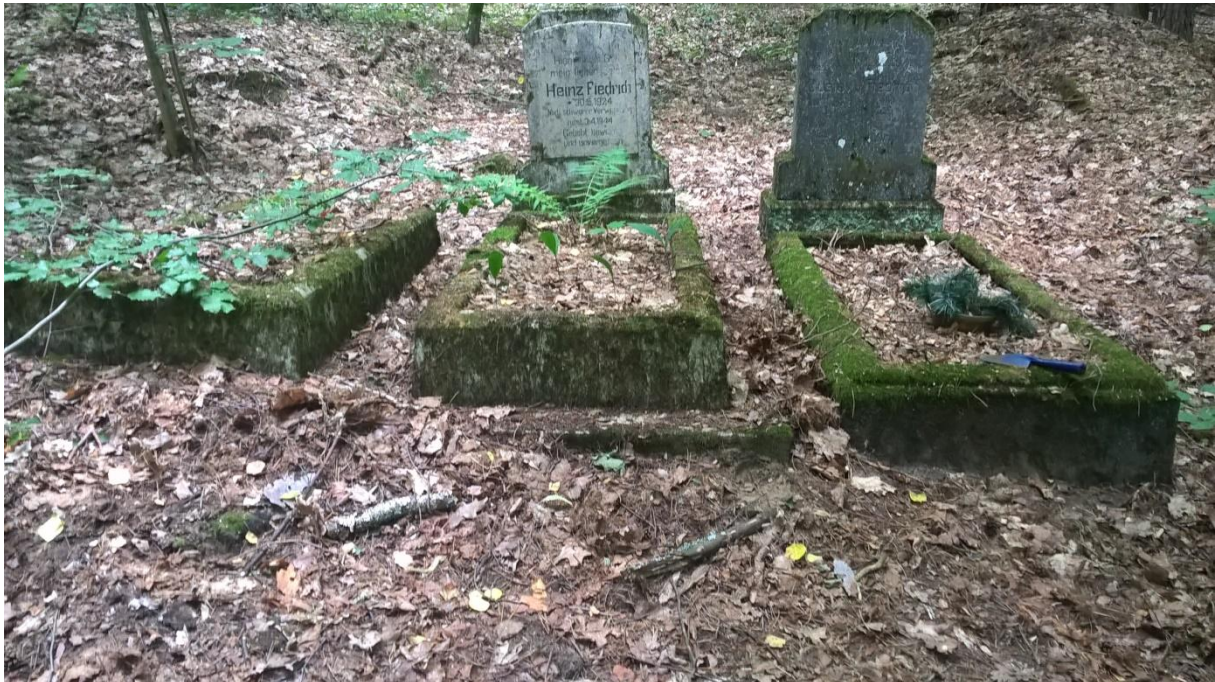
Ryc.6 Groby rodziny Fiedrich, lipiec 2019.

Za tymi grobami znajdują się kolejne tarasy, na których mogły znajdować się groby ziemne, co obecnie jest ciężko stwierdzić.