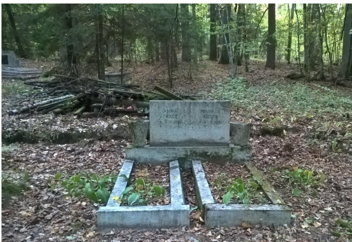
Ryc.9 Grób rodziny Kratz po wykonaniu prac naprawczych i porządkowych, wrzesień 2019.