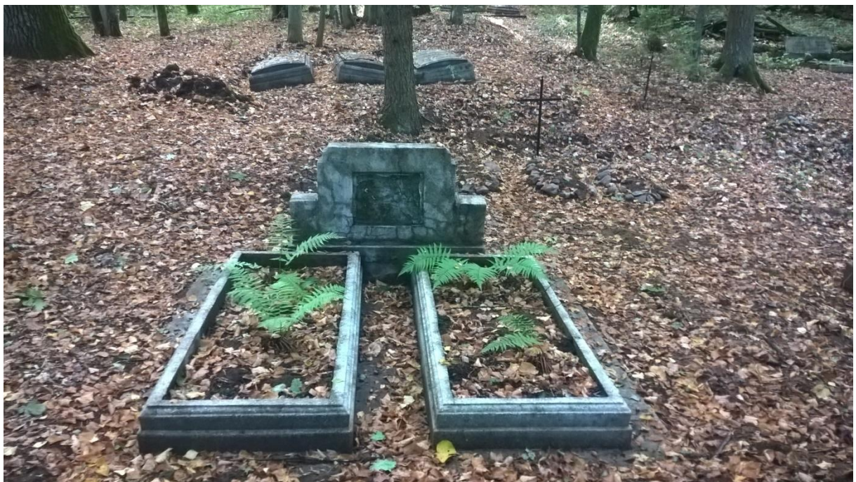
Ryc.12 Groby 17 i 18, wrzesień 2019.

Opaski betonowe produkcji powojennej, przed nim nagrobek pozbawiony tablicy.