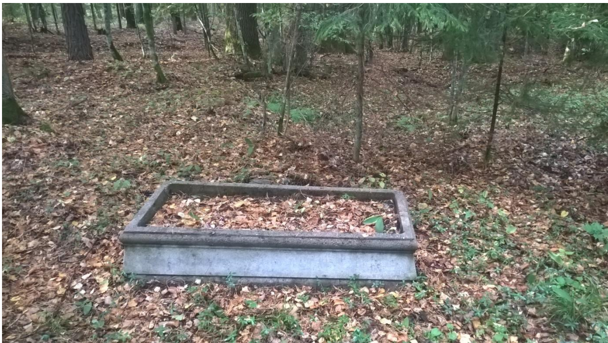
Ryc.24 Grób nr 33, wrzesień 2019.

Betonowa opaska, po jej kształcie i wykonaniu można wnioskować, że jest produkcji przedwojennej.